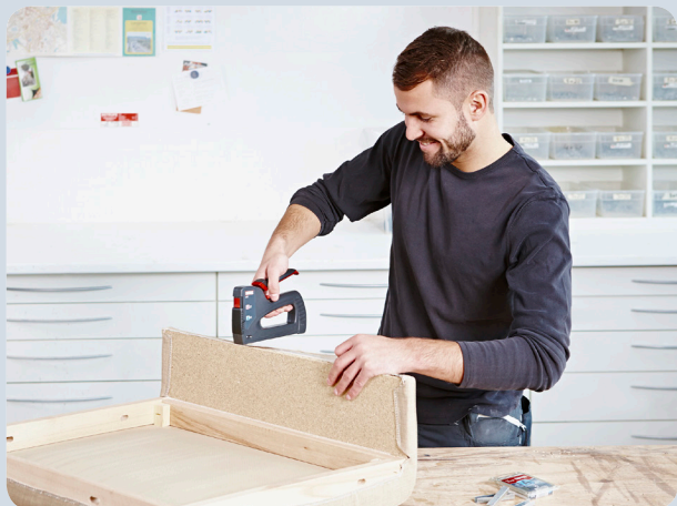
Einfaches Befestigen vom Stoffen beim Polstern.