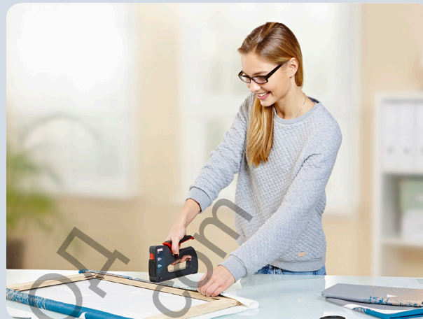
Schnelles Bespannen von Bilderrahmen.