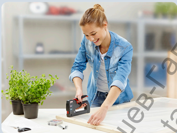
Schnelles Befestigen von Folie.